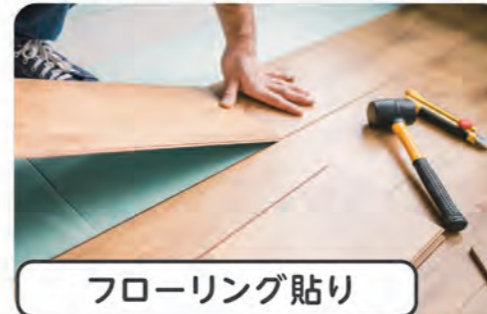
フローリング貼り

床面の材質にこだわりたい方へ!木の温もりを感じる味わいあるお部屋に仕上がります!