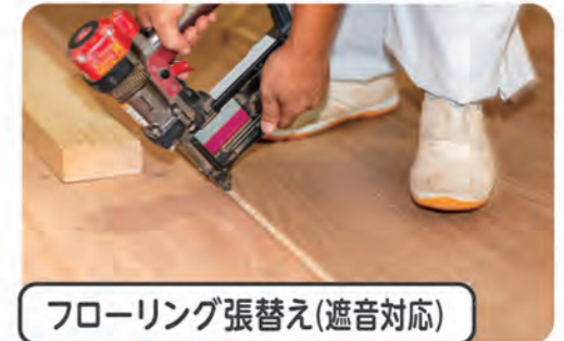
フローリング張替え(遮音対応)

衝撃音を軽減するタイプのフローリング張替えで、住まいの居心地をさらにグレードアップ!